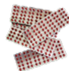
żelazo dla mam